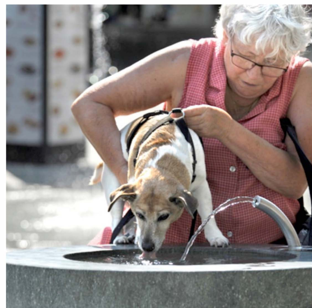
Trinkbrunnen am Gallberg