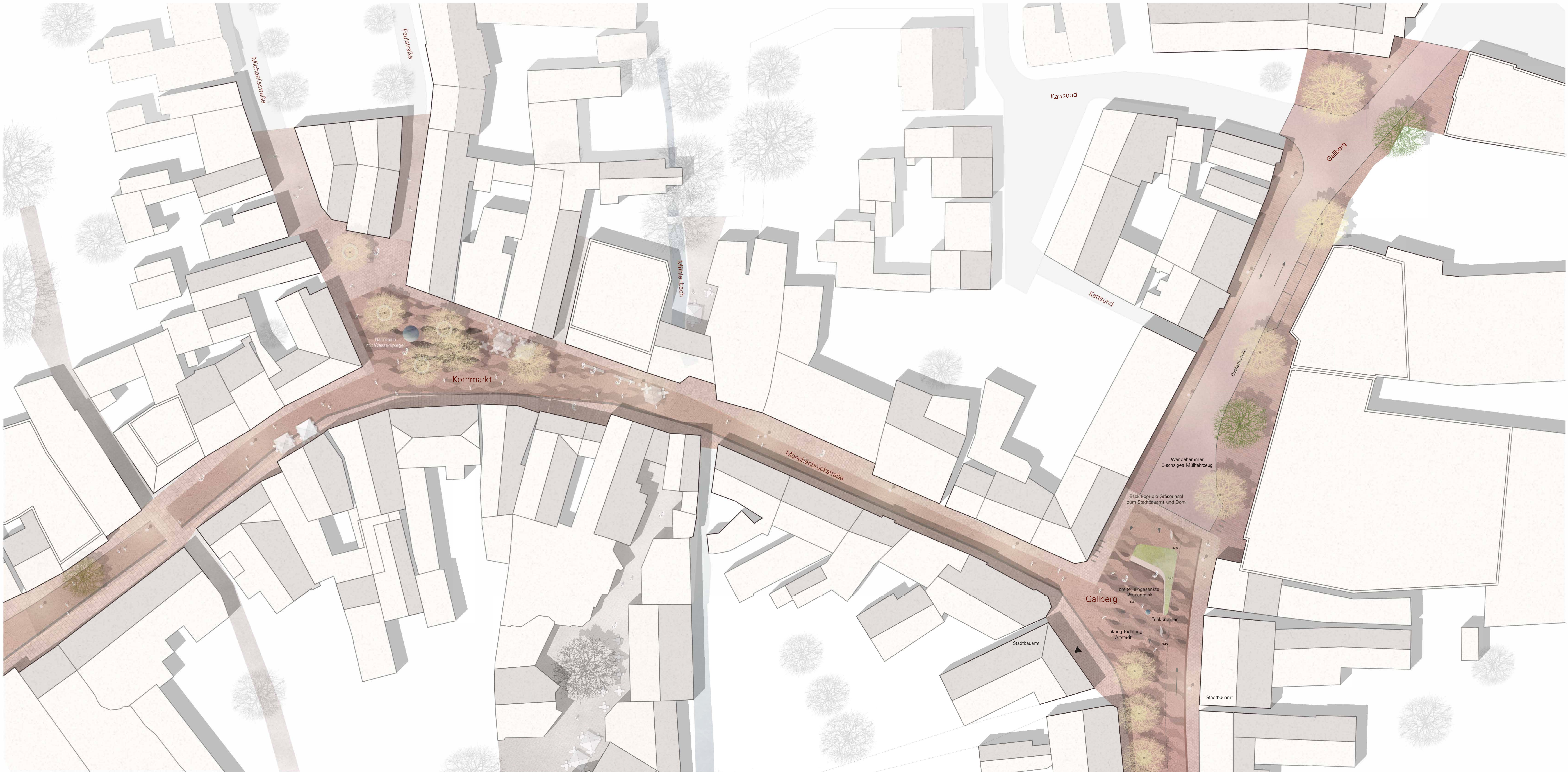
Kornmarkt und Gallberg 1:250